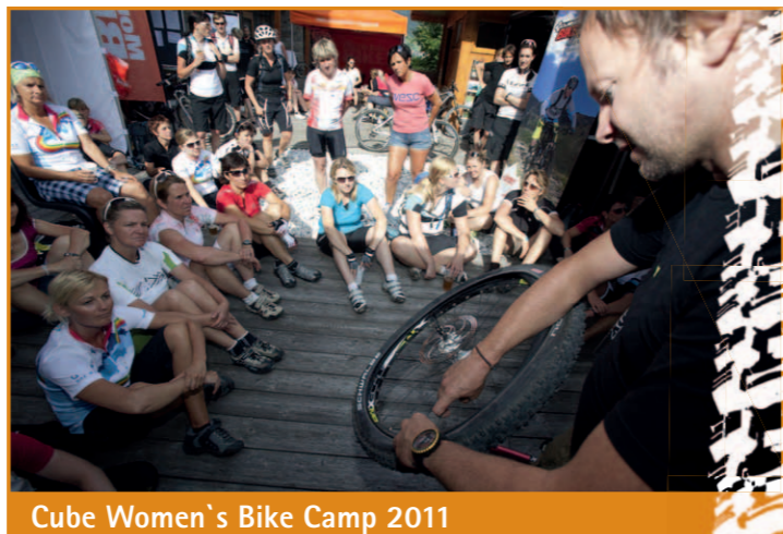
Cube Women's Bike Camp 2011