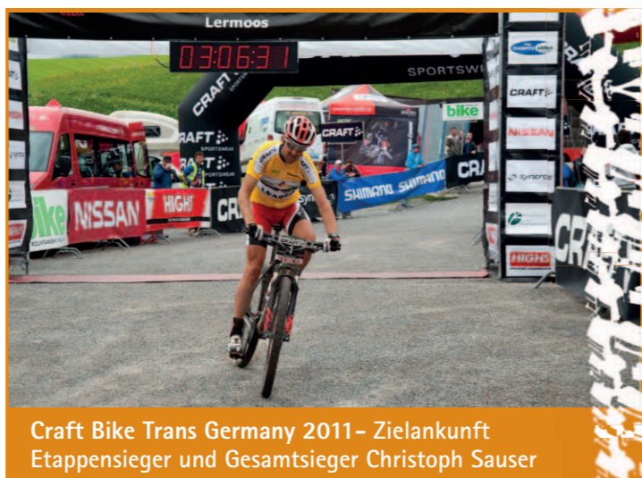
Craft Bike Trans Germany 2011- Zielankunft Etappensieger und Gesamtsieger Christoph Sauser

Aktuelle Informationen über MTB Events finden Sie auf: www.zugspitzarena.com